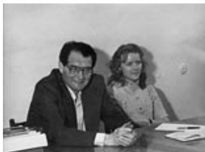
17 мая 1980 г. На заседании кружка гражданского права