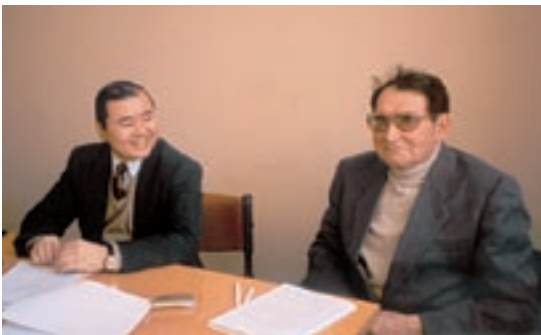
Работа над Гражданским кодексом РК. 1995 г.

Жизнь Ю.Г. Басина можно разделить на 3 этапа: