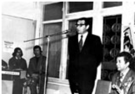
В общежитии №9 юридического факультета КазГУ. 23 февраля 1978 г.

го заочного института (1949 – 1950 гг.); преподаватель АЮШ Минюста КазССР (1950 – 1952 гг.); преподаватель, ассистент АГЮИ (1952 – 1955 гг.); затем – в КазГУ (1955 – 1995 гг.): проходит путь от ассистента до профессора, зав. кафедрой гражданского права юрфака (заведовал кафедрой более тридцати лет – в 1969 – 1990 гг.); десять лет работал деканом юрфака (1975 – 1985 гг.). В 1990 – 1995 гг. – проф. кафедры гражданского права юрфака КазГУ (КазГНУ). В 1994 – 1997 гг. он – проф. кафедры гражданского права нового государственного юридического вуза Казахстана – Казахского государственного юридического института (затем – университета).