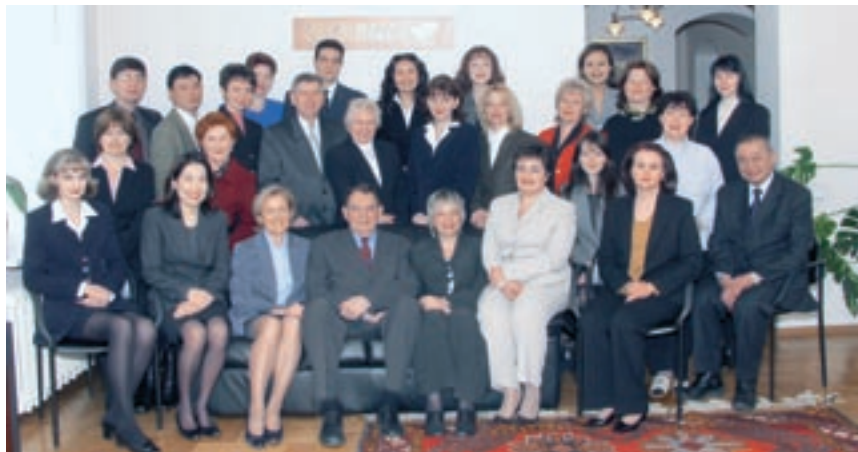
10 лет “Эквитасу”. Алматы, 2003 г.