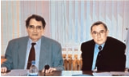
г. Алматы, 2004 г.