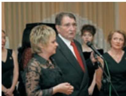
24 января 2003 г. 10-летний юбилей «Эквитас»

в) в обществе по-прежнему преобладает потребительское отношение: используют знакомство и общение с Басиным в корыстных целях 25%, чтобы наслаждаться – 75%, бесплатно восполнить пробелы в образовании – 45%, причем 100% респондентов делают это с нескрываемой гордостью;