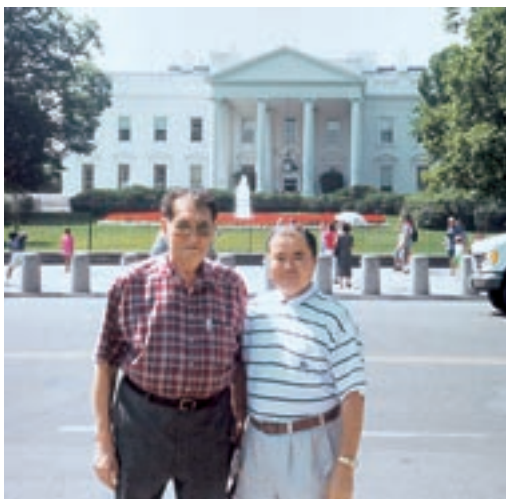
Вашингтон. Белый дом. Август 1999 г.