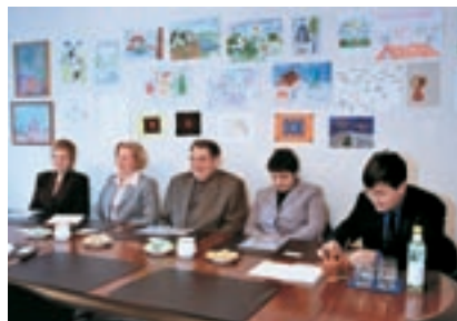
31 января 2004 г. Офис фирмы «Эквитас»