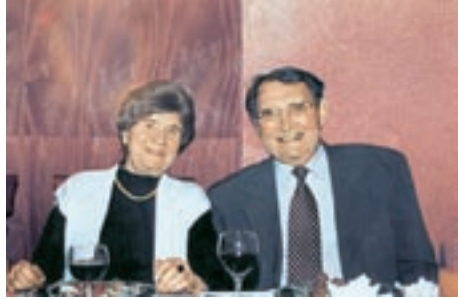
Встреча 2002 года

Впереди – большая жизнь. Путь, полный радостей, тревог, самоотверженной работы на благо Родины. Немало трудностей встретится еще на этом пути. Но не страшны они, когда цель ясна, когда знаешь, что всегда в трудную минуту тебя поддержит крепкая верная рука друга!