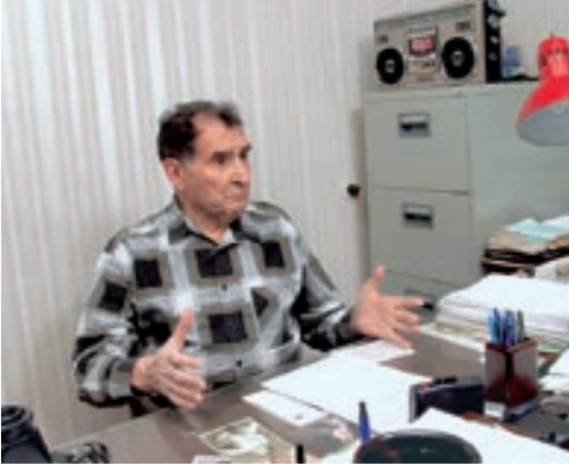
За рабочим столом

Потому что можно планировать производить как можно больше, но заставить производителя быть постоянно инициативным, стремиться взять потребителя качеством своих товаров без конкуренции невозможно. И самое главное, что все экономические и производственные фонды принадлежали государству. Признаваемые иные виды собственности (например, кооперативно-колхозная) были фикцией.