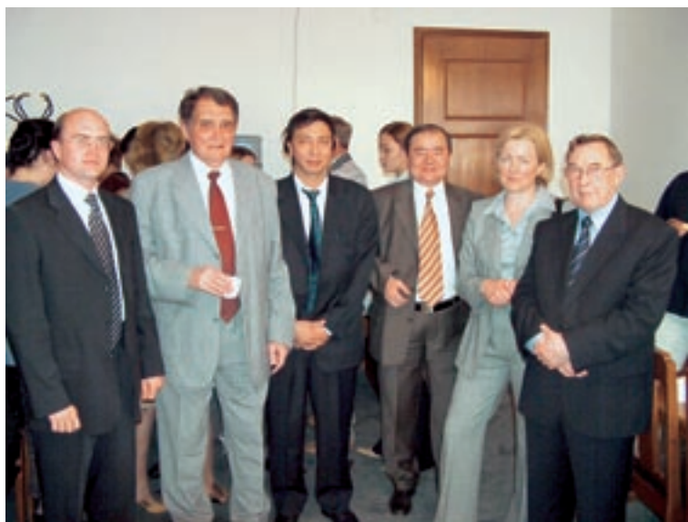
На конференции НИИ частного права КазГЮУ, май 2004 г.

Большое счастье, что все это было. Незримые нити, связывавшие нас, останутся навсегда.