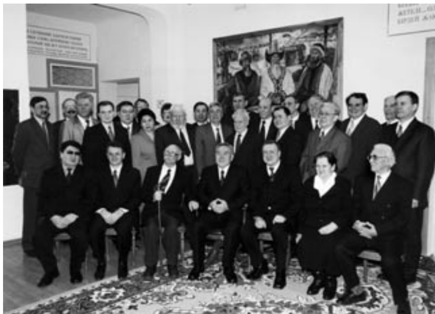
Профессорско-преподавательский состав Высшей школы права «Әділет» с президентом Н.А. Назарбаевым

был членом многих научно-консультационных советов: Конституционного Суда РК, Верховных Судов КазССР и РК, Высших Арбитражных Судов КазССР и РК и других государственных органов.