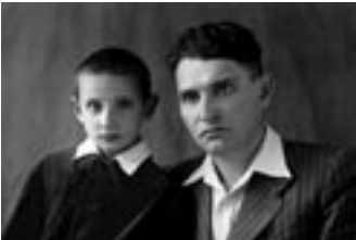
С сыном Володей