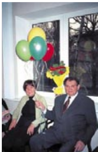
7 марта 2001 г. Офис фирмы «Эквитас»

Я больше ничего не хочу добавлять к сказанному здесь. Я только хочу пожелать всем коллегам-юристам, наверное, несбыточного – хоть в человеческом, хоть в профессиональном плане – хотя бы чуть-чуть стать похожими на него. Это будет лучшая дань его памяти.