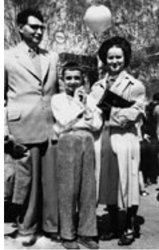
Всей семьей на Первомайской демонстрации

В 1950 году экстерном окончив институт, он получил диплом с отличием.